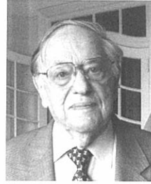
ドナルド・キーン

一九二二年、米国ニューヨークに生まれる。米国コロンビア大学、同大学院、ハーバード大学大学院で学ぶ。英国ケンブリッジ大学を経てコロンビア大学で日本文学を担当。京都大学大学院にも留学。コロンビア大学名誉教授。アメリカ・アカデミー会員。日本文学士院客員。対し勲二等旭日重光章、二〇〇八年には文化勲章受章。世界における日本文学・日本文化研究者の第一人者。