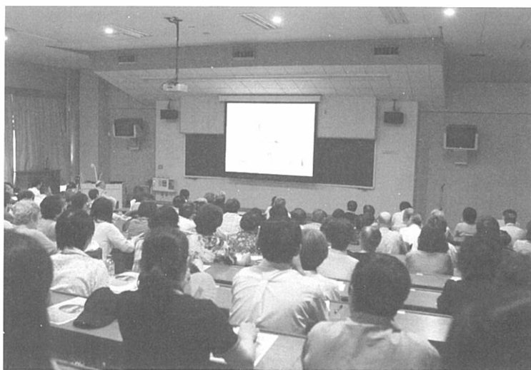
別室の中継モニターで講演を聴く聴衆

もう、日本文学は世界の文学に加わりました。無視できません。以前は、例えば世界の詩歌という選集があれば、日本の俳句が一つか二つあれば