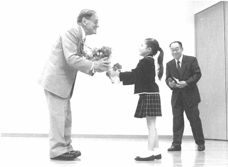
北海道インターナショナルスクールの8歳の生徒から 花束を受け取るドナルド・キーン名誉教授

〔付記〕本稿は、二〇一二年七月十八日、札幌 大学文化学部が主催し、札幌大学附属総合 研究所が共催で開催した札幌大学創立四十五 周年記念講演会の記録集である。